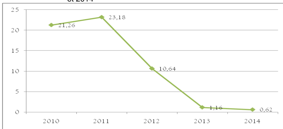
Graphique 11. 2 : Evolution du pourcentage d'élèves inaptes aux examens de l'OBC entre 2010 et 2014