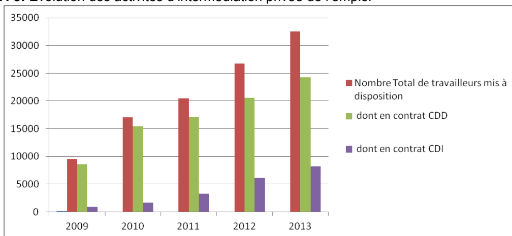
Graphique 7. 3: Evolution des activités d'intermédiation privée de l'emploi